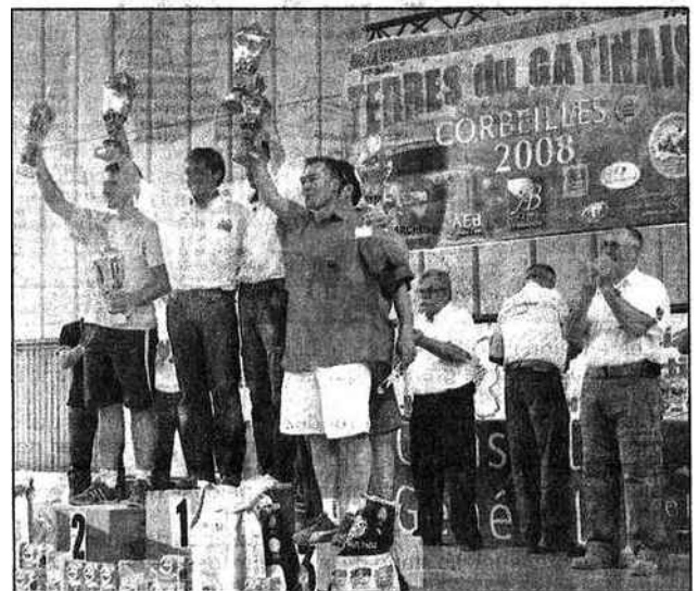
Les grands vainqueurs des ces trois jours d'épreuves de 4x4 Retrouvez tous les résultats en pages sportives !

équipages et public réunis - se sont rassemblés autour d'un vin d'honneur bien mérité. Les mêmes mots se passaient des uns aux autres : « Vivement l'année prochaine ! »