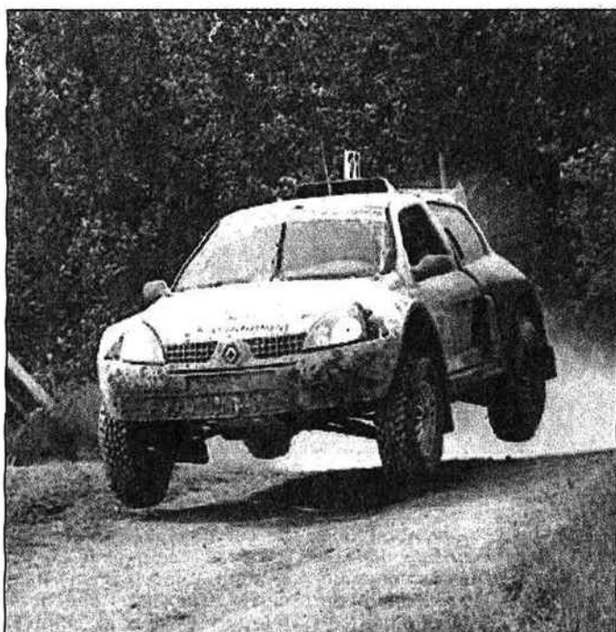
70 concurrents s'affronteront dans le Corbeillois durant trois jours

Le Comité organisateur - qui n'est autre que le Comité départemental du sport automobile du Loiret - n'aurait jamais pu faire face à l'ampleur d'un tel événement sans l'aide essentielle du conseil municipal de Corbeilles et l'accueil favorable des communes de Chapelon, Lorcy, et Mignerette. L'Ecurie du Gâtinais, qui bénéficie avantageusement depuis l'an dernier des retombées du rallye (100 adhérents à ce jour), est l'organisatrice technique de cette grande manifestation.