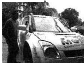
Retour au garage pour une nouvelle intervention.