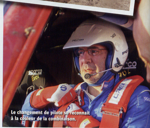
Le changement de pilote se reconnaît à la couleur de la combinaison.