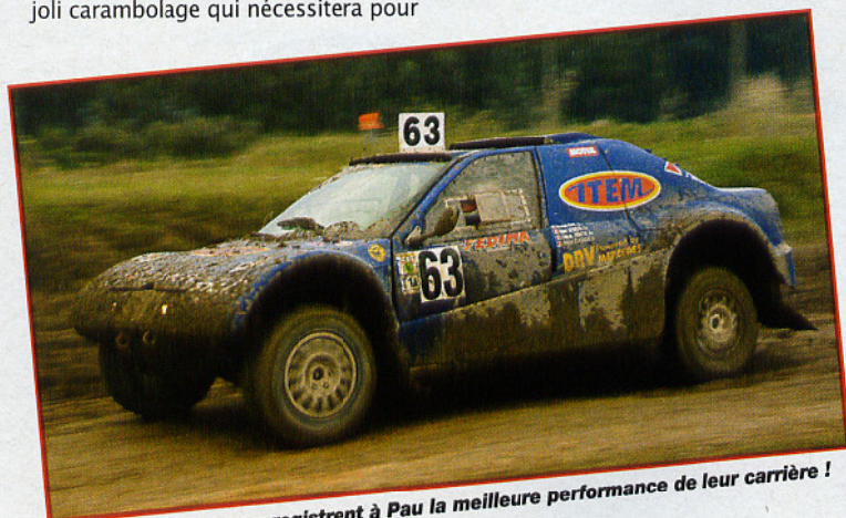
Demota-D'Encausse enregistrent à Pau la meilleure performance de leur carrière !