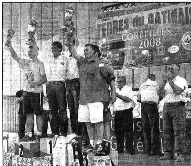
Les grands vainqueurs des ces trois jours d'épreuves de 4x4 Retrouvez tous les résultats en pages sportives !

équipages et public réunis - se sont rassemblés autour d'un vin d'honneur bien mérité. Les mêmes mots se passaient des uns aux autres : « Vivement l'année prochaine ! »